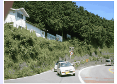
真鶴道路からの入口