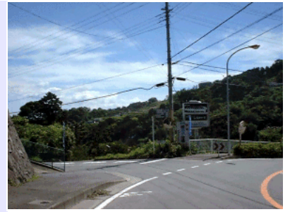
国道135号線からの入口